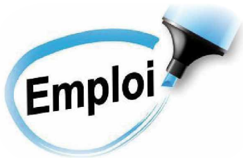
Table des partenaires pour l'intégration en emploi dans Bellechasse

Responsable : Marie-Josée Roy, CISSS Chaudière-Appalaches